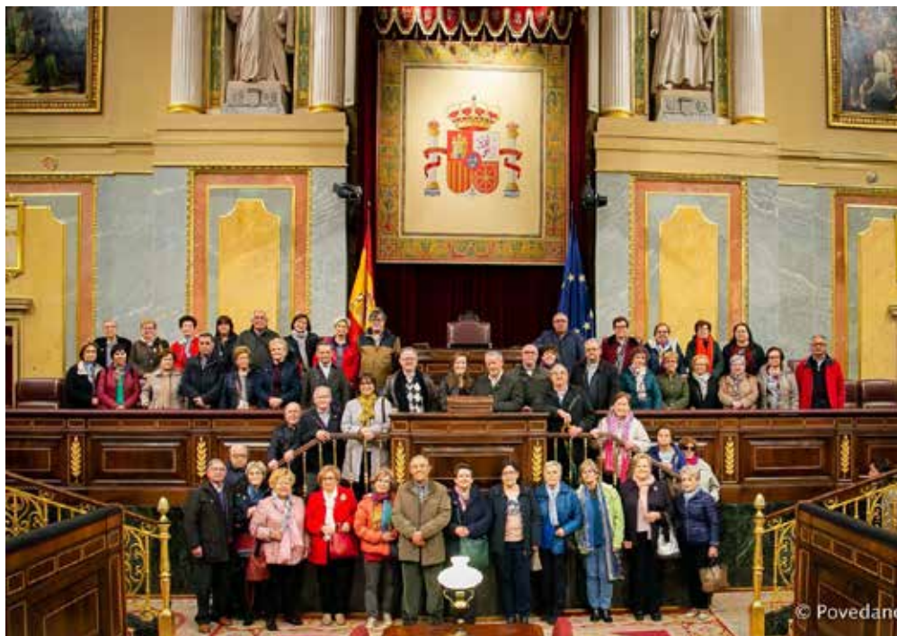
Congreso de los Diputados

Desde el hotel en Rota, se hicieron visitas a