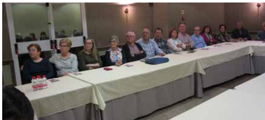
Curso Básico Albacete