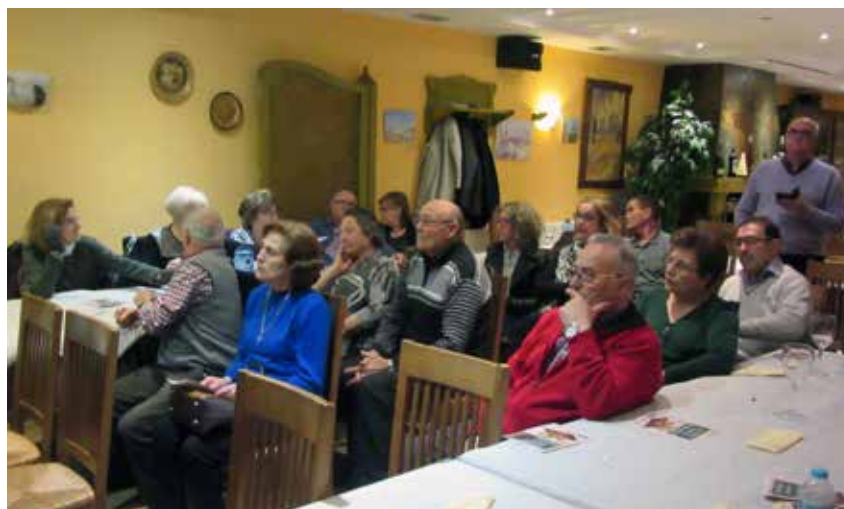
Curso Básico Pedro Muñoz