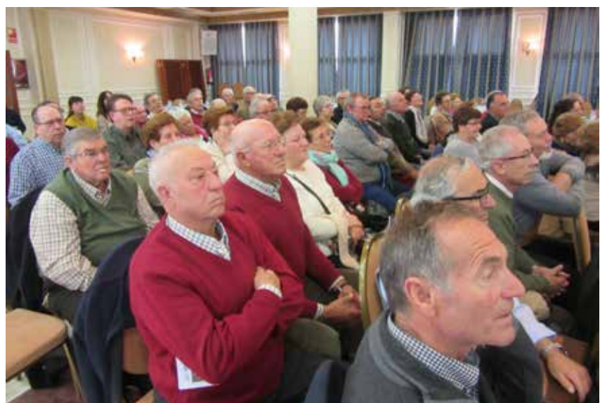
Asistentes en Talaverade la Reina

Hace especial mención al Voluntariado Social, que se inició en 1995, al darse cuenta el Presidente de entonces y