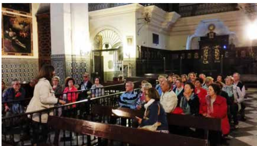
San Lúcar de Barradema