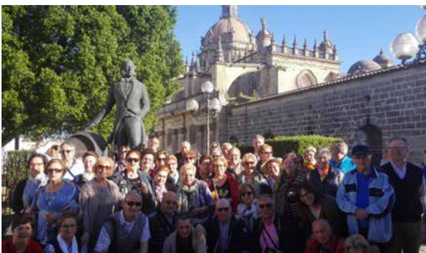
Jerez de la Frontera