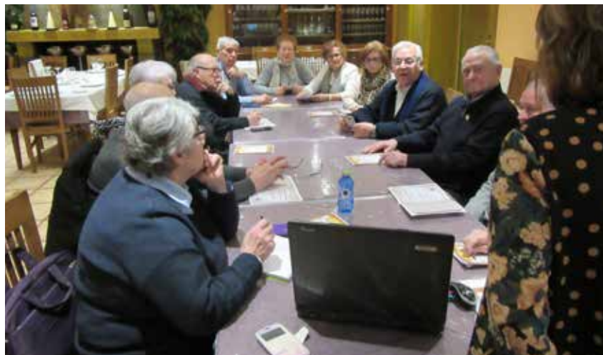
Curso Coordinadores en Pedro Muñoz

En este primer cuatrimestre de 2018, se han celebrado otros cursos para Nuevos Volunta-