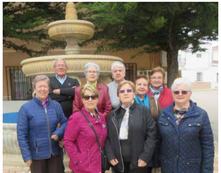
Curso Básico Navas de Jorquera