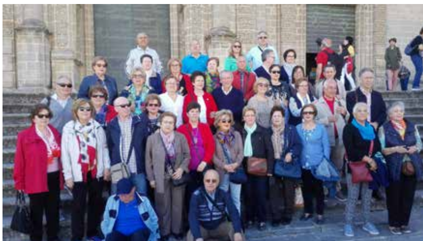
Arcos de la Frontera

Degustamos el buen marisco propio del lugar y, con energías renovadas, volvimos el sábado 21, después de muy buen viaje.