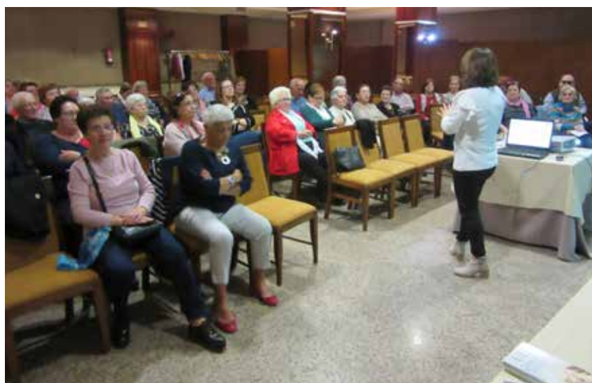
Curso Coordinadores en Albacete