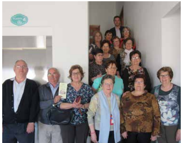
Curso Básico Iniesta