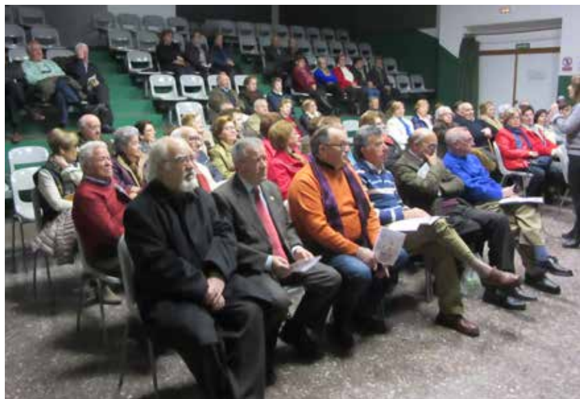
Asistentes en Alpera

Que sigamos trabajando nuestras capacidades, y cada mañana tengamos una motivación, una ilusión, cada uno su ilusión. Es importante también, como Voluntarios de UDP que somos, que transmita-