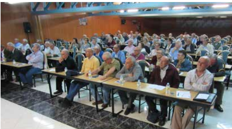
Asistentes en Toledo

"Sois un colectivo importante para la sociedad, reforzando los lazos de humanidad y sentimiento por plena convicción. Agradezco a UDP el trabajo impagable que hace y os deseo que disfrutéis de la vida. La jornada queda clausurada".